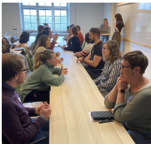
Speed-dating i Kristianstad