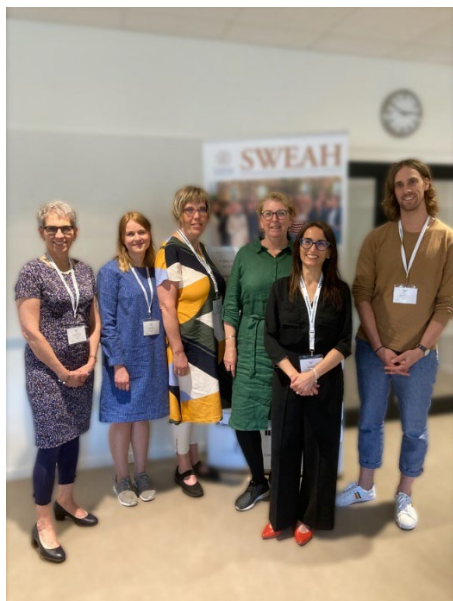
Deltagare i SWEAH:s symposium vid NKG

SWEAH var en av sponsorerna och deltog med flera programpunkter i 26th Nordic Congress of Gerontology i Odense, Danmark, 8–10 juni, 2022. SWEAH presenterade också sin verksamhet med broschyrer, avhandlingar och informationsmaterial i en monter. Där hölls också ett uppskattat och välbesökt mingel under en av dagarna. Forskare från forskarskolan och medarbetare på olika nivåer (doktorander, postdoktorer, studiekoordinator, koordinator) presenterade sin forskning i symposiet Ageing, technology and health in later life: Results from the interdisciplinary national graduate school in Sweden .